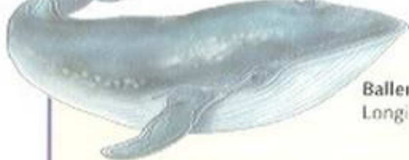
Ballena azul. Longitud: 25-30 metros.

Hay dos tipos de ballenas: las que tienen barbas, como la ballena azul, y se alimentan de plancton o pequeños peces, y las que tienen dientes, como el cachalote, y se alimentan de animales grandes.