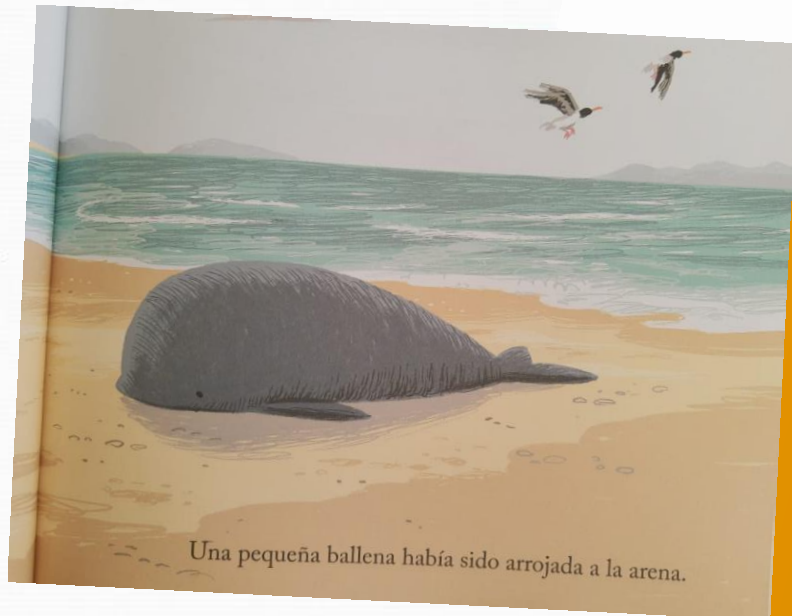
Una pequeña ballena había sido arrojada a la arena.